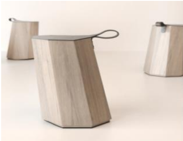
Sieht real aus, ist aber noch ein Rendering