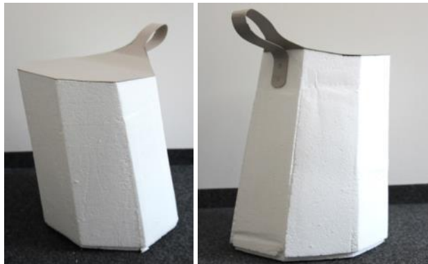
Modell in Originalgröße für ausgiebige Sitzproben