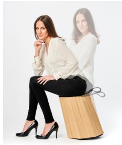
Knapp ein Jahr liegt zwischen den ersten Skizzen und dem fertigen Hocker

Ein weiteres wichtiges Anliegen ist uns die hochwertige Verarbeitung der gesamten Marlon-Kollektion – ressourcenschonend und auf Langlebigkeit ausgelegt. Wir produzieren sie deshalb in aufwendiger handwerklicher Manier in Deutschland. Die verwendeten Hölzer sind FSC-zertifiziert; Bezugsstoffe, Leder sowie die Sitzfilze für unsere Stühle und den 8Stool beschaffen wir innerhalb der EU.